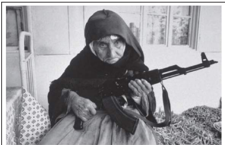
1990- Evini koruyan 106 yaşında bir Ermeni kadın.

Քանի հազար տարի է պետք, որ նա մե՛կ էլ աշխարհ գա... Երեկոն ավարտվեց Էրիկ Գրիգորյանի «Հայաստան» երգով: Լիլիա Շահբազյան